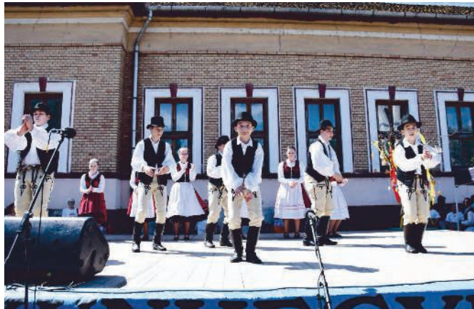
Nagy községi kert aratott gyermeink néptánc bemutatója