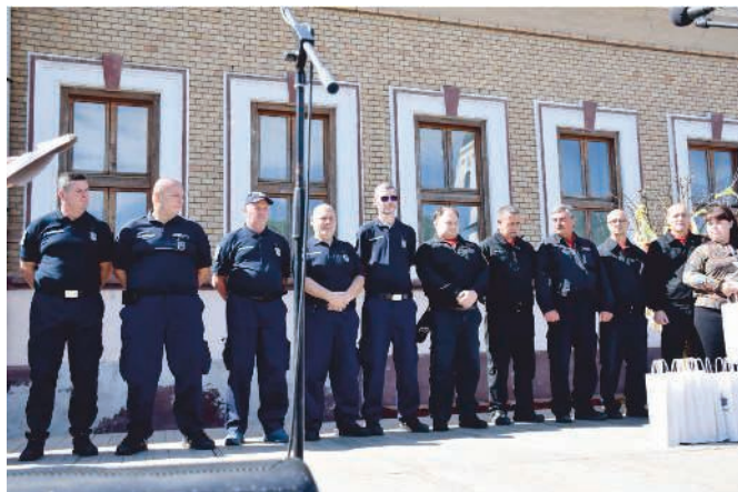
Szabó András polgármester megjutalmazta a rendőröket, tűzoltókat, polgárőröket és megköszönte áldozatos munkájukat