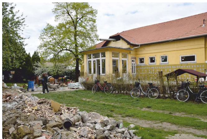
Lassan elkészül a Garay Óvoda felújítása, mely része a 250 milliós projektnek