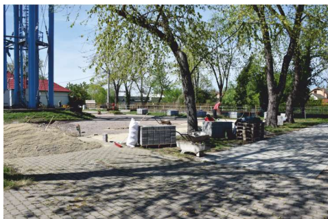
A piactér negyedik ütemének munkálatai, amihez még több mint 600 m 2 szilárd burkolatot készít a nyertes pályázó cég