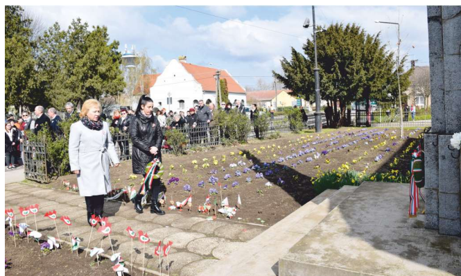
A hősök emlékművénél koszorúzással ért véget a megemlékezés