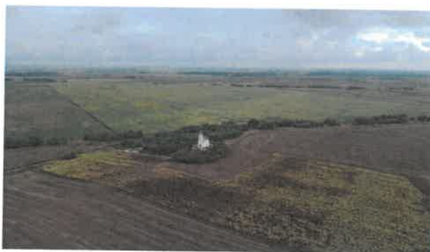
Térkép és fotó a Kisfás halomról, rajta a 2020-ban felújított Szent Mór kápolna https://balays.blog.hu/2022/01/31/szent_moric_kapolna