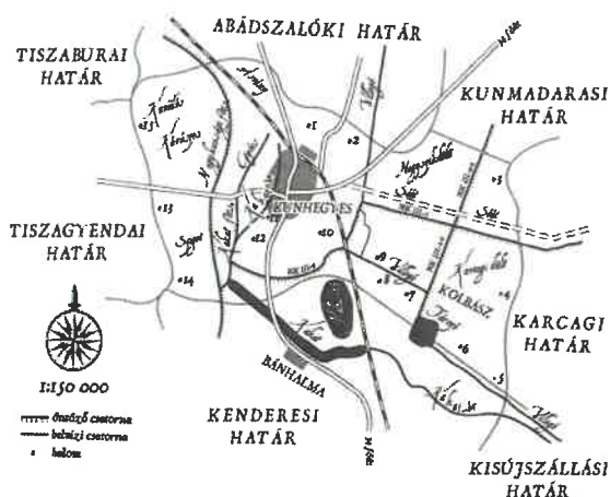
Térkép a kunhegyes környéki kunhalmokról