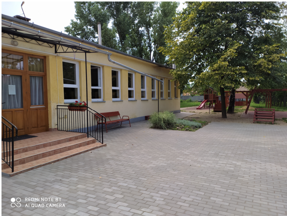
Az óvoda központi bejárata az udvar felől

Óvodánkban a drámapedagógia módszereit alkalmazzuk a csoportjainkban, mellyel színesítjük óvodánk arculatát, gazdagítjuk ünnepeink színvonalát.